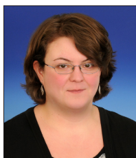
Anett Breitsprecher VDZ Akademie GmbH Markgrafenstraße 15 10969 Berlin

Bitte schicken Sie so bald wie möglich die obenstehende Fax-Anmeldung an Fax-Nr. 030 . 72 62 98 - 114 oder per Post an: